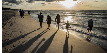
Les Balades sur la Plage