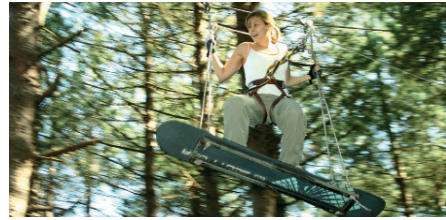
Opalaventure - Ouvert 7j/7 +33 (0)6 81 64 23 42