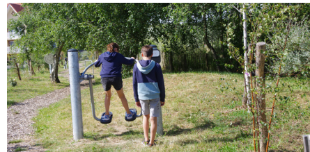
Les agrès de Fitness - Parc de la chaumière

Conception : Office de Tourisme de Camiers-Sainte-Cécile