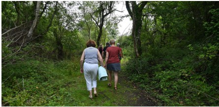
Le Domaine du Rohart à Camiers