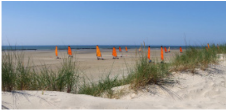
Le char à voile - +33 (0)3 21 89 60 81