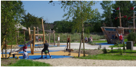
Les jeux pour enfants Parc de la Chaumière - Gratuit