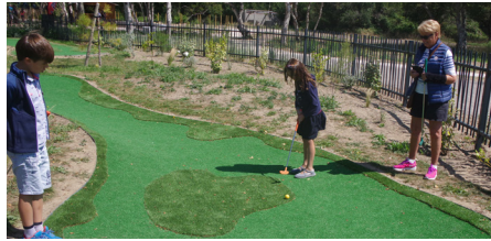
Le Mini-Golf - Parc de la Chaumière +33 (0)7 81 98 46 33